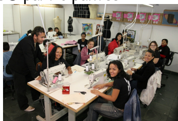
Projeto Ofício Moda